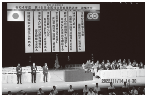
壇上左側に友本大会会長（右）、下地大会委員長（左）ら、来賓の方々も多く出席（壇上右側）した沖縄大会