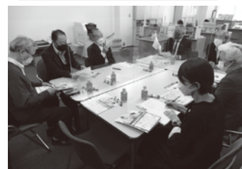
2022年10月20日に開催した支部長会

▶若い人向けの店はお客様が戻っているが、宴会の利用はまだ少ない ▶グーグルマップに店を登録したら、飛び込みで来店した20代の方がリピーターになってくれた ▶店では換気扇を24時間回している ▶二酸化炭素の検知器も必須 ▶アクリル板がじゃまと言われるが、自分を守るためにも必要 ▶お客様は来店を控えていても店を気にかけてくれているので、それにどう応えるか ▶若いお客様は元気なので営業時間延長の働きかけを ▶組合ホームページに組合員のお店を載せてはどうか ▶客引きは違法だが、お店の案内を求めるお客様はいるので適正な案内方法があるといい