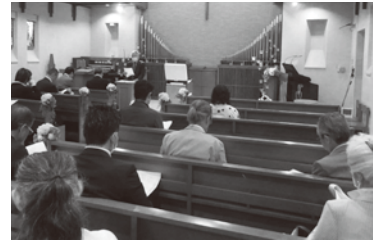
議事進行。名古屋ガーデンパレスにて

全社連・中日本ブロック連絡協議会は、6月13日に名古屋ガーデンパレスで「令和5年度総会」を開催し、北陸・東海・近畿の各府県組合理事長らが出席しました。11月13日開催の「全国社交飲食業代表者広島大会」で行われるカラオケ選手権のブロック選考会と、懇親会も開催しました。