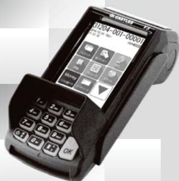
据置型端末機も ご用意しています

JCB, AMERICAN EXPRESS, Diners Club, VISA, Mastercard 3.24%の手数料率は、 以下2点を条件に適用されます