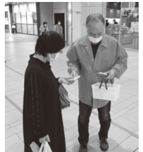
通行者に啓発グッズを手渡す白濱会長(右)