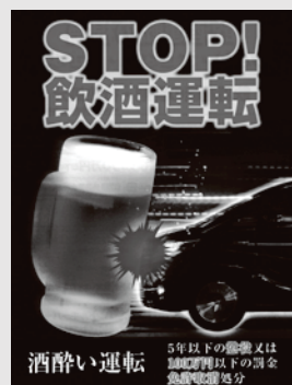
飲酒運転の根絶を呼びかけるチラシ