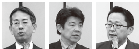
堀公庫名古屋支店 国民生活事業統括