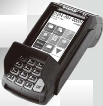
据置型端末機も ご用意しています

JCB, AMERICAN EXPRESS, Diners Club, VISA, Mastercard