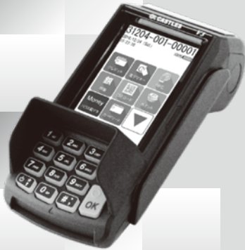
据置型端末機も ご用意しています

JCB, AMERICAN EXPRESS, Diners Club, VISA, Mastercard